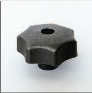
Rosca directa pasante. Fe: Fundición gris, arenada.