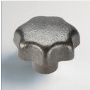
Rosca directa. Fe: Fundición gris, arenada.